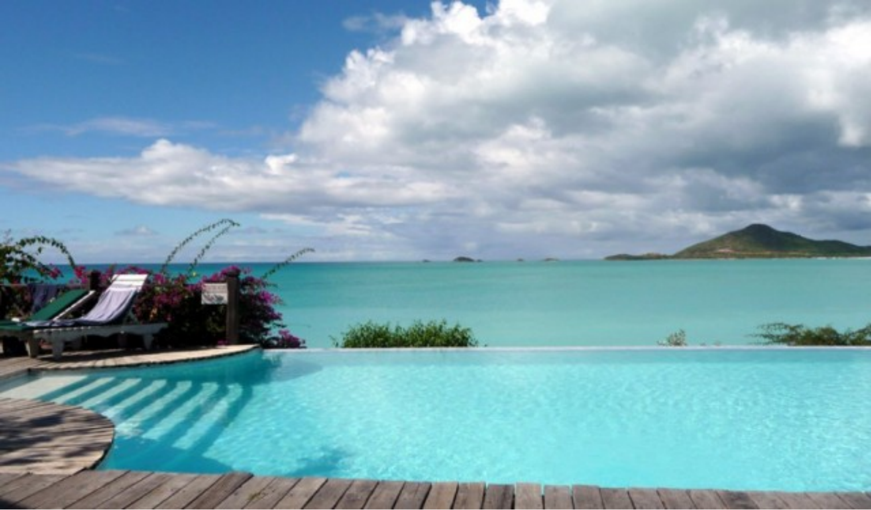
Piscina Infinity View 017 BAIRES

La piscina del vostro giardino dovrà avere un'anima e soprattutto dovrà diventare un tutt'uno con l'ambiente che la circonda. La bellezza della vostra piscina dipenderà dal suo aspetto, dalla forma e dal colore dell'acqua oltre che dal paesaggio in cui sarà immersa, dai colori che sarà in grado di riflettere e dalla personalità che saprà trasmettere.