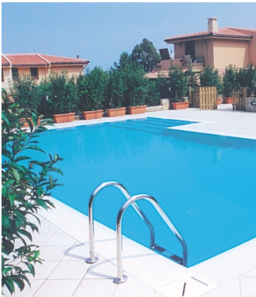
REALIZZAZIONE: PISCINE SYSTEMS - Palermo Progetto piscina e impianti: Carmelo Greco, architetto