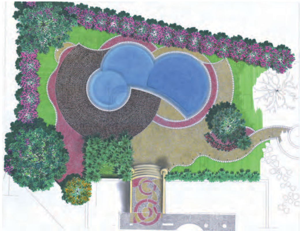
↑ Disegno del progetto della piscina.

che, draceni e palme. A questo si aggiunga che la pavimentazione è stata posata appositamente per creare forme geometriche irregolari, così da diventare essa stessa prezioso decoro. In questo contesto, si inserisce la piscina, che si distingue – come accennato – per una forma irregolare. Nei suoi 95 mq di superficie (capacità di 140 mc), questa piscina accoglie zone d’acqua a differente vocazione, che si distinguono tra loro per forma e profondità. Prima tra tutte: l’area relax, di forma circolare, dotata di 4 piastre geyser, 4 jet idromassaggio e 4 fari LED multicolor. Due le diverse profondità caratterizzanti questo specchio d’acqua: una costante di 1,2 m e una che digrada fino a 2,5 m. □