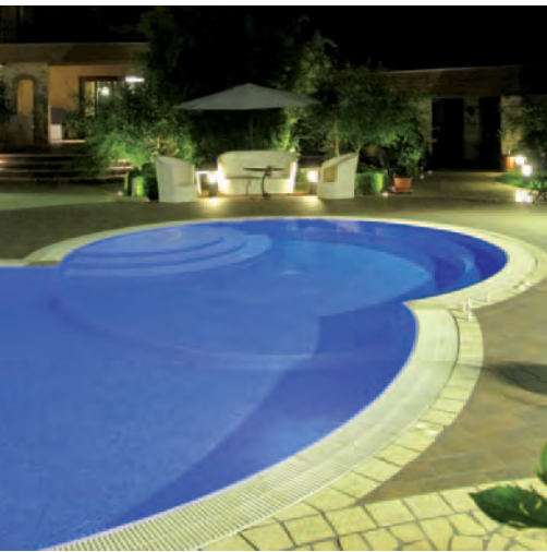
↑ La pavimentazione è stata posata appositamente per creare forme geometriche irregolari, così da diventare essa stessa prezioso decoro.